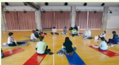
リラックスできて気持ちいいね！