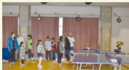
マシンから飛び出す速球に挑戦！