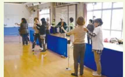
初めてだけど見事命中！